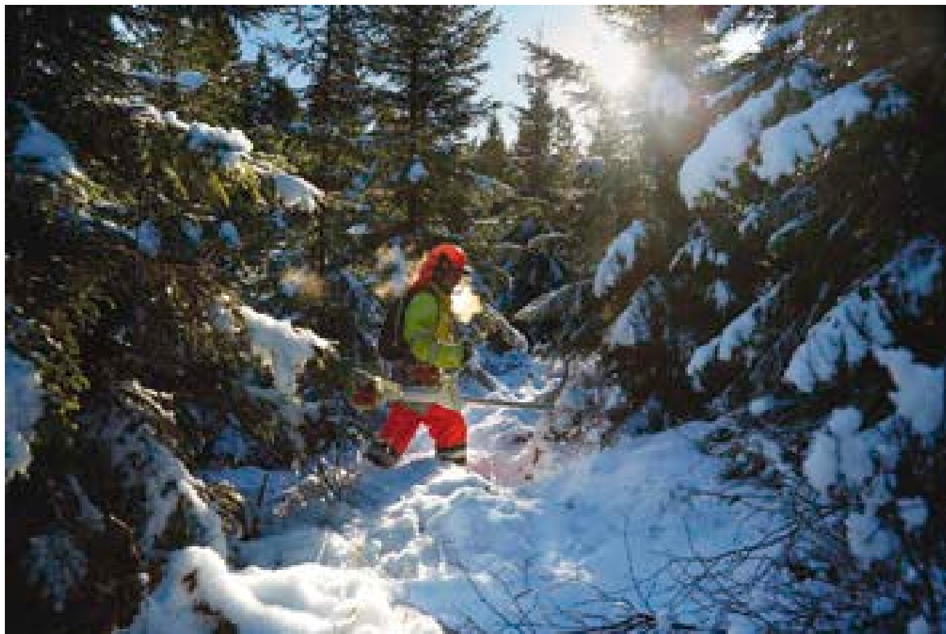
En bra dag går det att röja 1,5 hektar per person. Kylan är inget problem, men det går inte att röja sly när det är för mycket snö.

exakt hur det går till, eftersom förmågan att hitta rätt personer i Polen är nyckeln till hans företags framgång. Men han berättar att han i år har fått omkring 3 500 ansökningar. 350 av dem kallas till intervju, och av dem plockas 15 personer ut. Han tar inte någon till Sverige utan att först ha träffat vederbörande på plats i Polen.