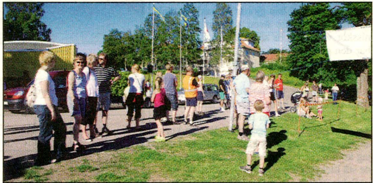
Några tappra "påhejare" vid målområdet.